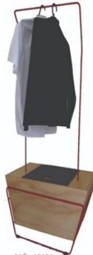
BAÚ e ARARA